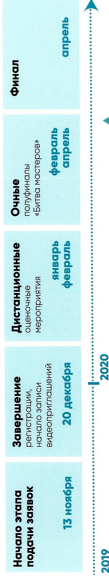
ГРАФИК ПРОВЕДЕНИЯ КОНКУРСА